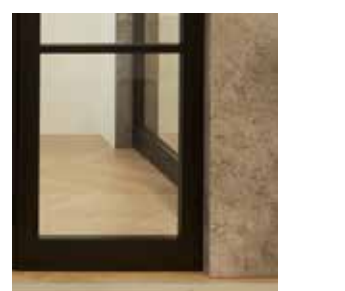
Transparant glas Verre transparent