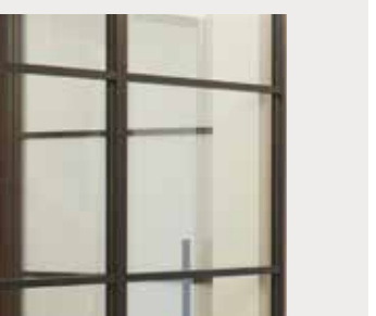
Greeploos Sans poignée