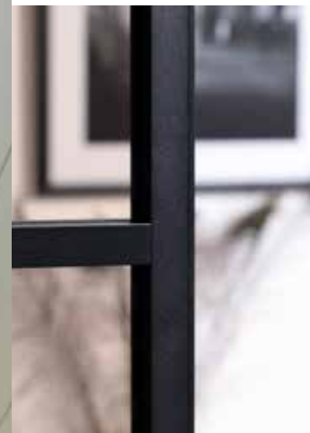
Rookglas Verre fumé