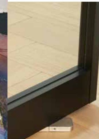
Taatsdeur Porte pivotante