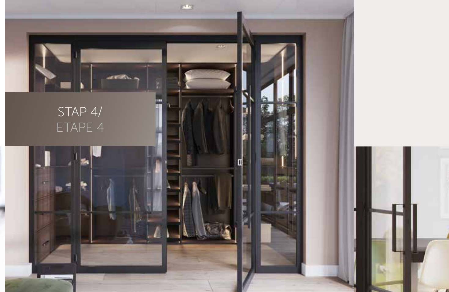
Dubbele draaideuren in model INDU3B met bargreep 1200 mm gecombineerd met linker en rechter zijpanelen Double porte battante INDU3B avec poignée de barre 1200 mm avec impostes latérales gauche et droite