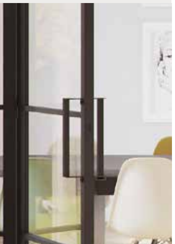
Beugelgreep Poignée en arc