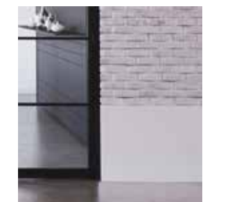
Draaideur Porte battante