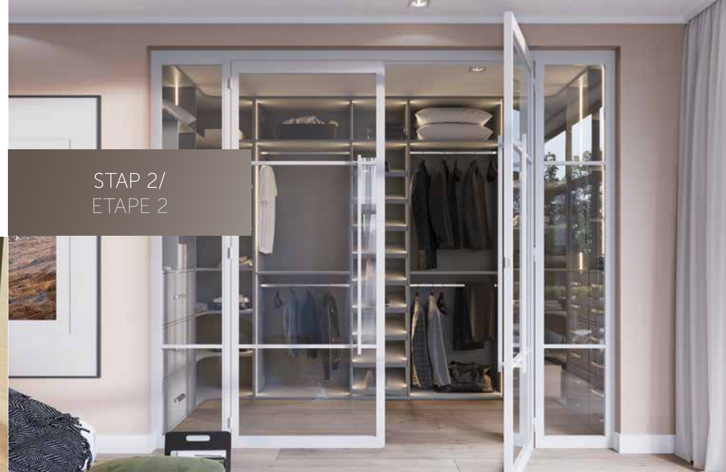
Dubbele draaideuren in model INDU3B met bargreep 1200 mm gecombineerd met linker en rechter zijpanelen Double porte battante INDU3B en blanc avec poignée de barre 1200 mm avec impostes latérales gauche et droite