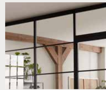
Combinatie van zij- en bovenpanelen Combinaison d'impostes latérales et haute

Indien de keuze valt op een draaideuropstelling of taatsdeuropstelling is er nog de mogelijkheid om deze uit te breiden met panelen aan weerszijden van de deur. Combinaties van draai- en taatsdeuren met zijpanelen kunnen geplaatst worden in een grootse entree waar ze de lichtinval maximaliseren.