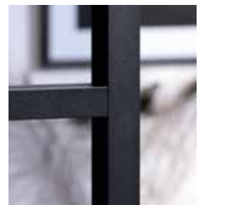
Subtiel grijs glas Verre gris subtil