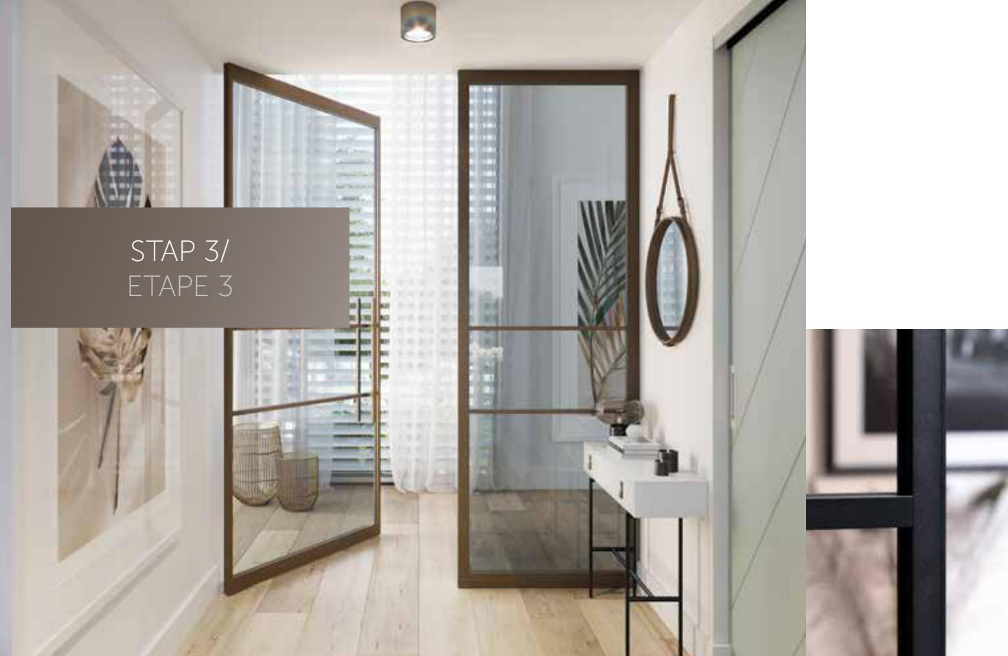
Enkele taatsdeur in model INDU3a met bargreep 750 mm, gecombineerd met zijpaneel Porte battante double INDU4 avec imposte latérale et poignée barre placée dans une véranda