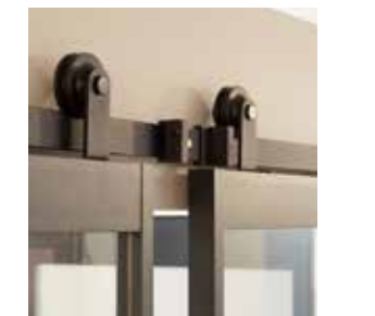
Schuifdeur Porte coulissante