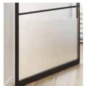
Mat glas Verre mat