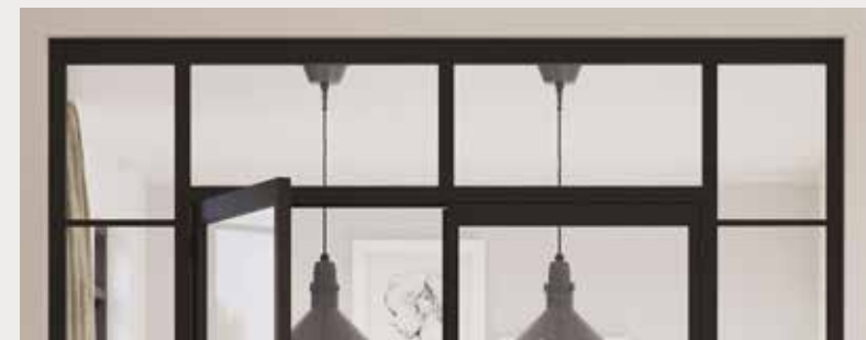
Bovenpanelen Imposte haute

Een paneel boven de deur kan worden toegevoegd bij de draaideuropstelling en laat de ruimte hoger lijken en geeft tevens mogelijkheid om de opstelling volledig tot het plafond te laten doorlopen.