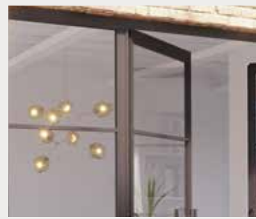
Zijpanelen Impostes latérales

Een paneel boven de deur kan worden toegevoegd bij de draaideuropstelling en laat de ruimte hoger lijken en geeft tevens mogelijkheid om de opstelling volledig tot het plafond te laten doorlopen.